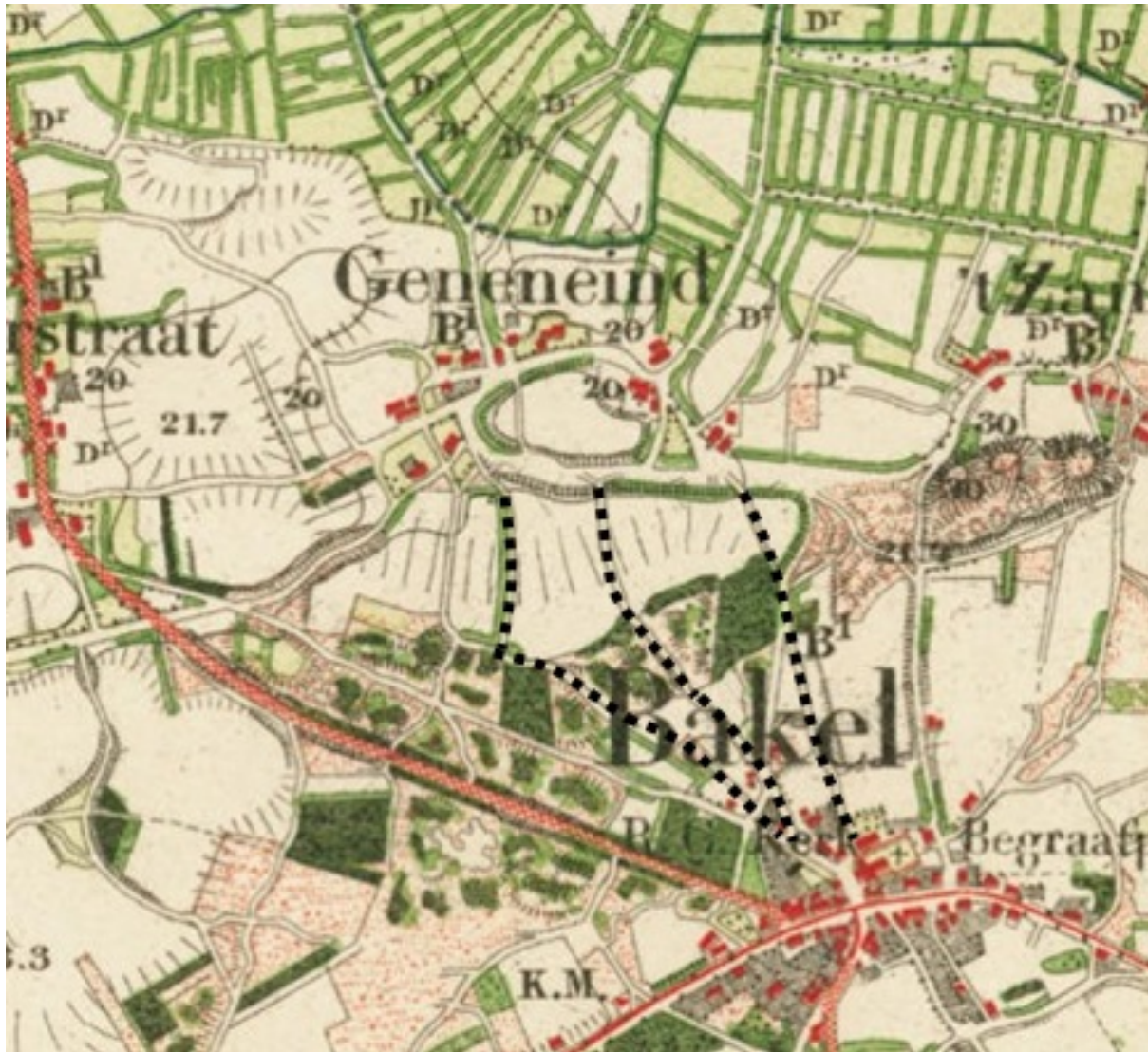
Situatie aan de noordkant van Bakel in 1900. Zwart gestippeld de Geneineindse kerkepaden. De meest rechtse is de huidige Bernardstraat.

De middelste pad op de kaart van 1900 is niet alleen in het bos, maar ook deels in het stratenpatroon bewaard. Herstel van dit kerkepad is het onderwerp en doel van deze notitie. Als we in deze notitie spreken over het kerkepad dan wordt daar steeds deze mee bedoeld.