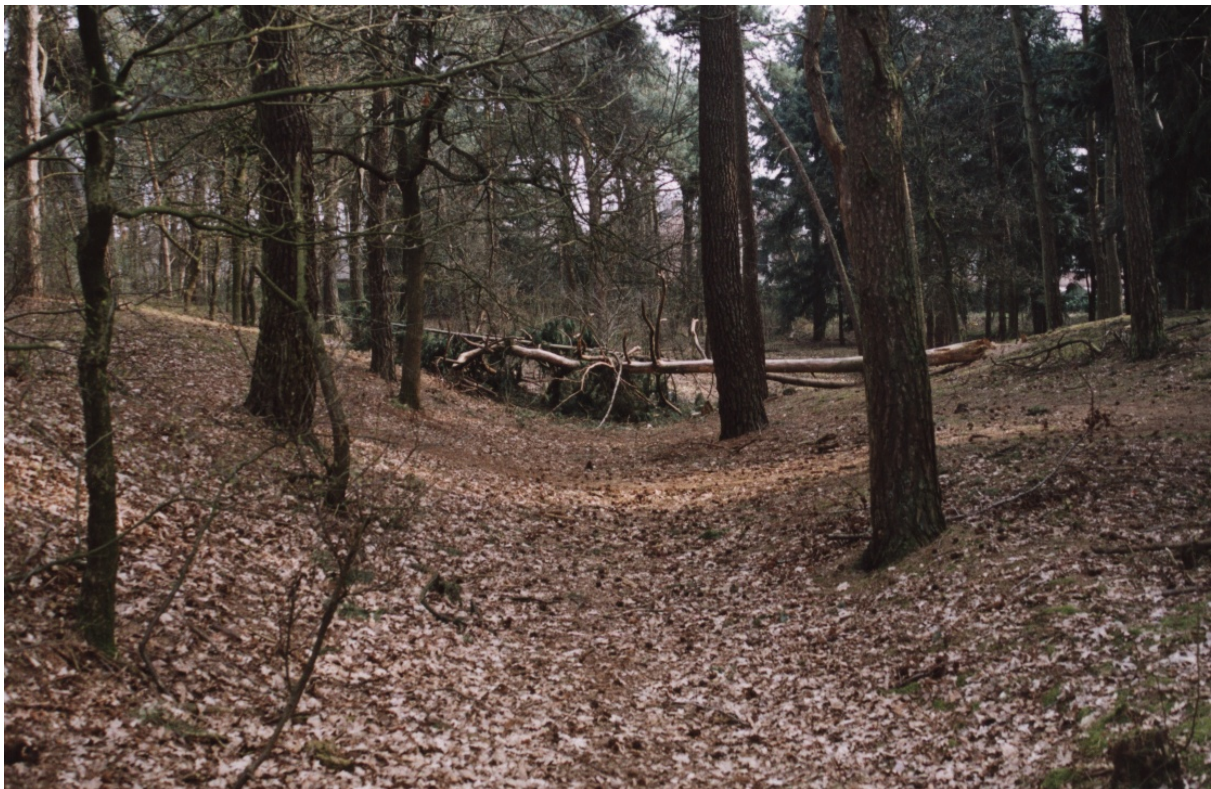
Het westelijke kerkepad van Geneineind is als 'uitgesleten' pad herkenbaar. Het wordt niet gebruikt, want hij is 'gedwarsboomd'.

Twee andere kerkepaden vanuit Geneineind zijn deels wel bewaard gebleven. Het gaat dan om de stukken die juist in het stuif- en bosgebied zijn achtergebleven. Deze delen van de kerkepaden zijn niet meer in gebruik als (wandel)pad, maar wel herkenbaar omdat het tracé van de paden is 'uitgesleten'. Door het gebruik van de paden raakt het zand los en gaat stuiven, zodat de paden langzaam maar zeker lager komen liggen. Het ziet er uit alsof ze zijn uitgesleten.