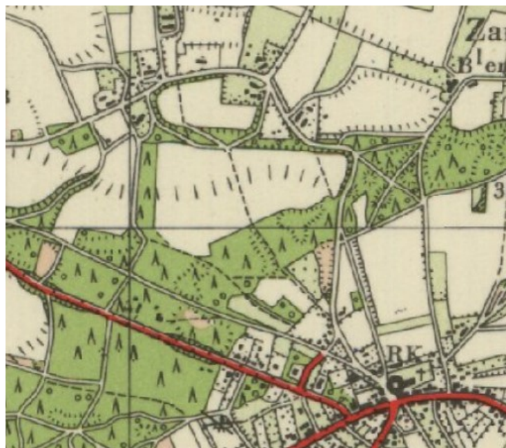
Weer een functie voor dit kerkepad.